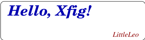
Figure 1 This is an example for manually numbered figure, which would not appear in the list of figures.

A large number of classical optimization methods have been developed to treat special-structural nonlinear programming based on the mathematical theory concerned with analyzing the structure of problems.