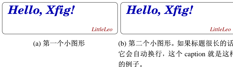
图 2.2 包含子图形的大图形。

大学之道，在明明德，在亲民，在止于至善。知止而后有定；定而后能静；静而后能安；安而后能虑；虑而后能得。物有本末，事有终始。知所先后，则近道矣。古之欲明明德于天下者，先治其国；欲治其国者，先齐其家；欲齐其家者，先修其身；欲修其身者，先正其心；欲正其心者，先诚其意；欲诚其意者，先致其知；致知在格物。物格而后知至；知至而后意诚；意诚而后心正；心正而后身修；身修而后家齐；家齐而后国治；国治而后天下平。自天子以至于庶人，壹是皆以修身为本。其本乱而未治者否矣。其所厚者薄，而其所薄者厚，未之有也！